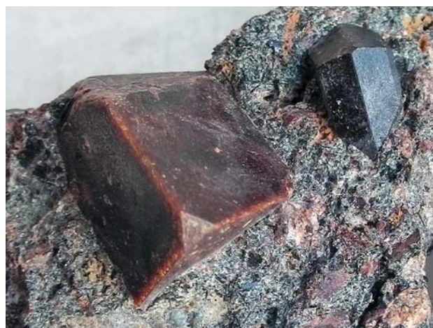
Кристалл селсуртита красно-коричневого цвета длиной около 3 см (слева) в ассоциации с лоренценитом темно-коричневого цвета (справа) [6].

Другое знаковое событие заключается в том, что в Ловозерском массиве (Кольский п-ов), на горе Селсурт открыт 31-й по счету минерал группы эвдиалита — селсуртит [6]. Этот гидратированный минерал (\text{H}_2\text{O})_{12}\text{Na}_3(\text{Ca}_3\text{Mn}_3)(\text{Na}_2\text{Fe})\text{Zr}_3\text{Si}[\text{Si}_{24}\text{O}_{69}(\text{OH})_3](\text{OH})\text{Cl} \cdot \text{H}_2\text{O} ( Z = 3 ) с параметрами ячейки a = 14.1475 \text{ \AA} , c = 30.361 \text{ \AA} , V = 5262.65 \text{ \AA}^3 , пространственной группой R3 утвержден КНМНК (ИМА №2022–026), а голотипный образец хранится в Ми-