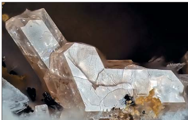
Рис.3. Кристаллы болотинаита.